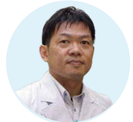
近畿大学产业理工学部 农学博士

高丽红参是一个备受关注的具有许多潜力的材料. 我们最近与九州著名大学和近畿大学合作进行了临床试验. 在试验开始的两周内, 饮用高丽红参的学生们开始显示出变化. 结果表明, 人参皂苷对提高年轻人的学习能力具有益处 , 我们已经提交了论文.